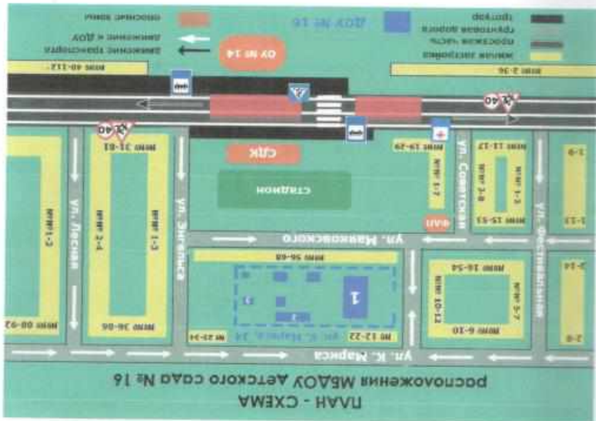
Район расположения образовательной организации, пути движения транспортных средств и детей (обучающихся).