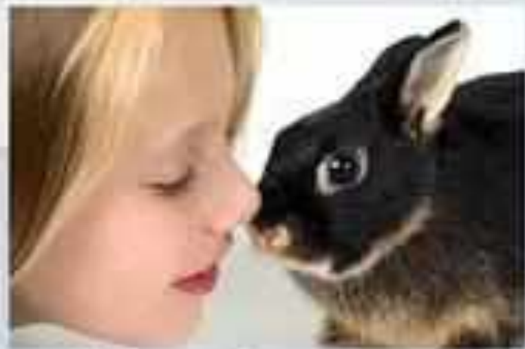
Любить и беречь животных