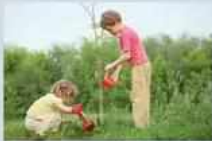
Ухаживать за растениями